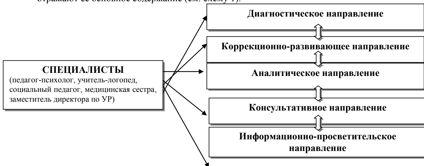
Схема 1. Направление коррекционной работы в МБОУ «Гимназия № 2»

Основные направления коррекционной работы МБОУ «Гимназия № 2» на ступени начального общего образования включают в себя взаимосвязанные направления, которые отражают её основное содержание (см. схему 1).