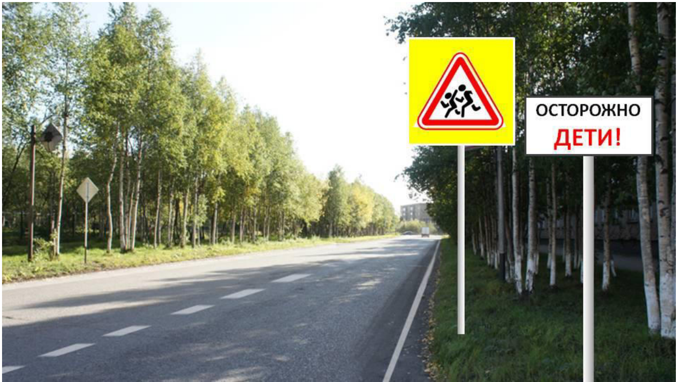
ул. Дзержинского д. №№ 19-25