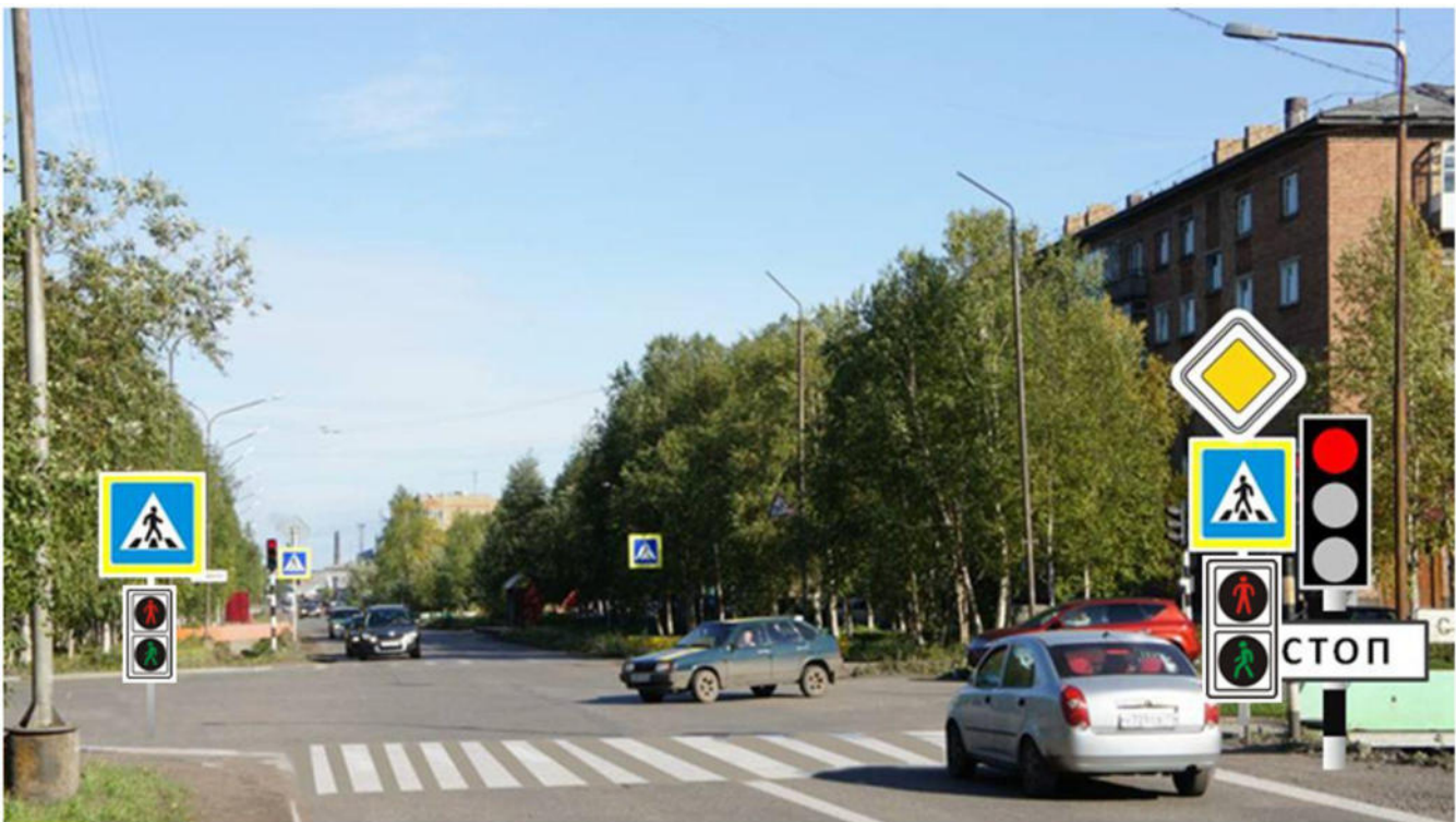
ул. Куратова д. №№ 19-22 - пешеходный переход