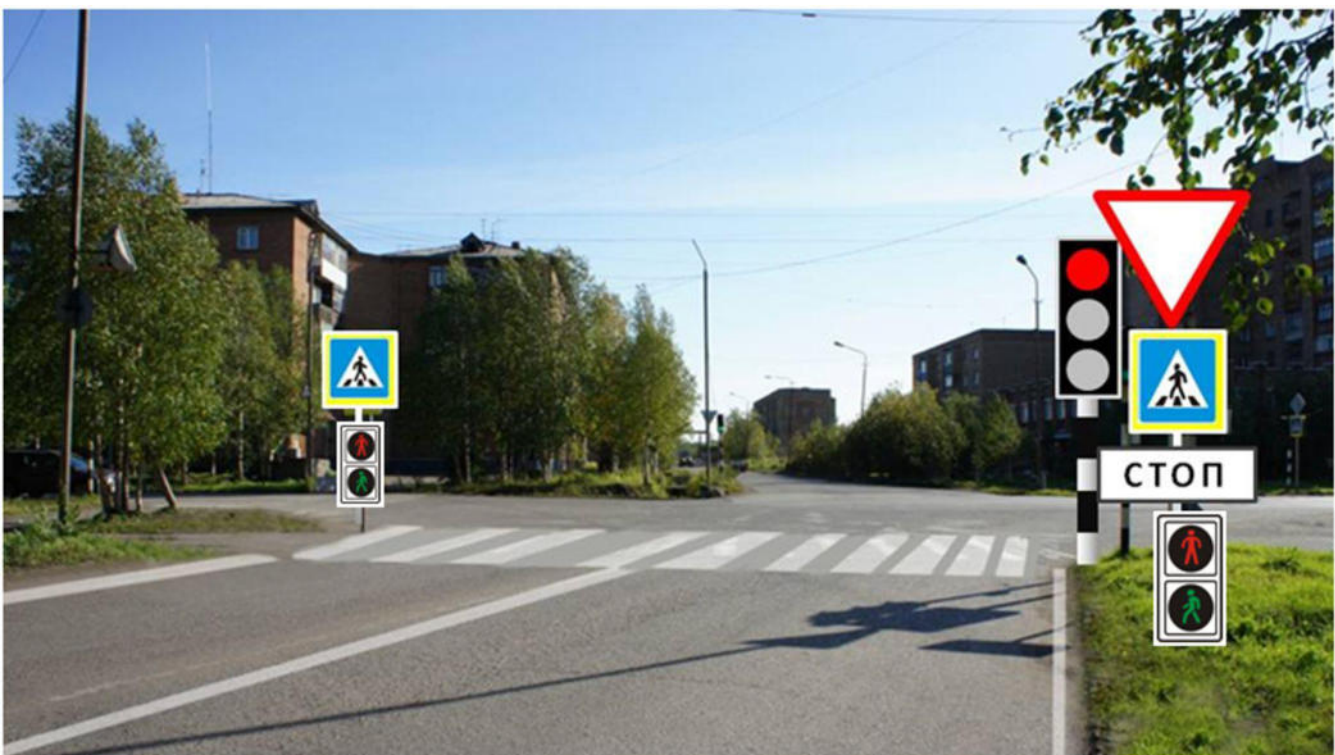
ул. Куратова д. №№ 20-22 - пешеходный переход