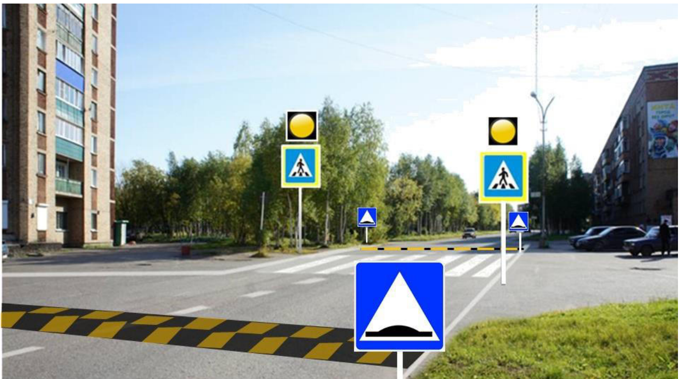
ул. Дзержинского д. №№ 19-25 - пешеходный переход