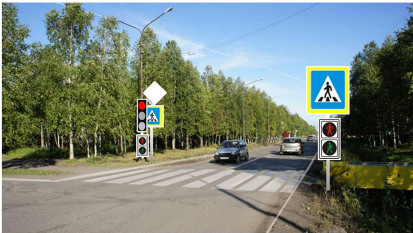
ул. Куратова д. №№ 17-20 - пешеходный переход