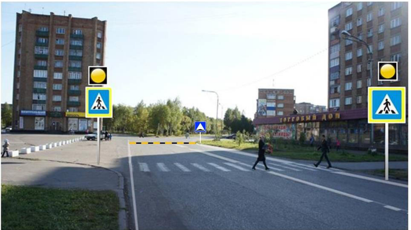
ул. Дзержинского д. №23 - пешеходный переход