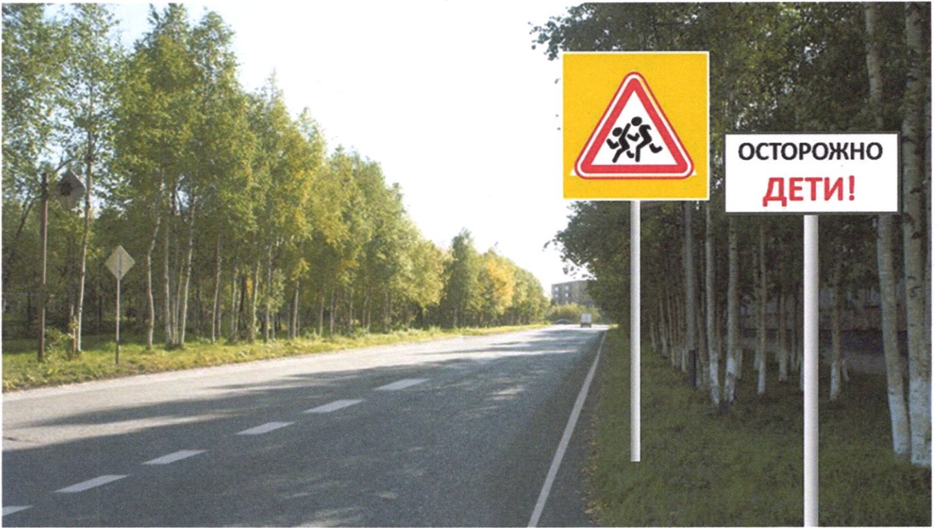
ул. Дзержинского д. №№ 19-25