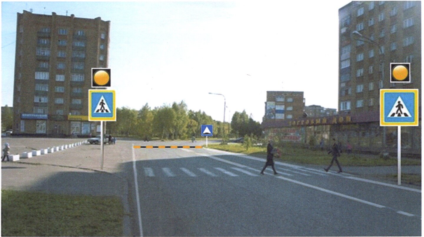
ул. Дзержинского д. № 23 - пешеходный переход