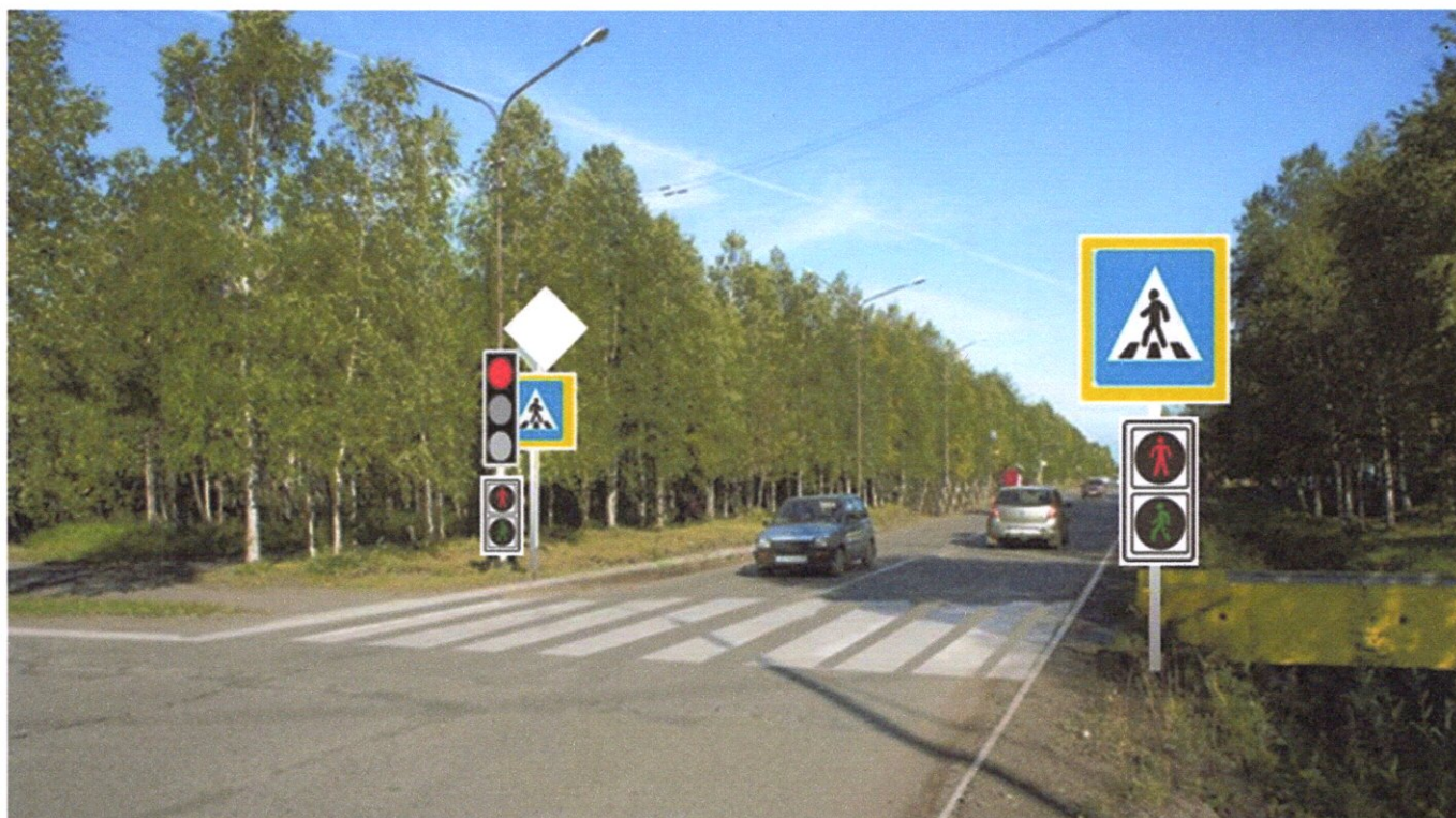
ул. Куратова д. №№ 17-20 - пешеходный переход