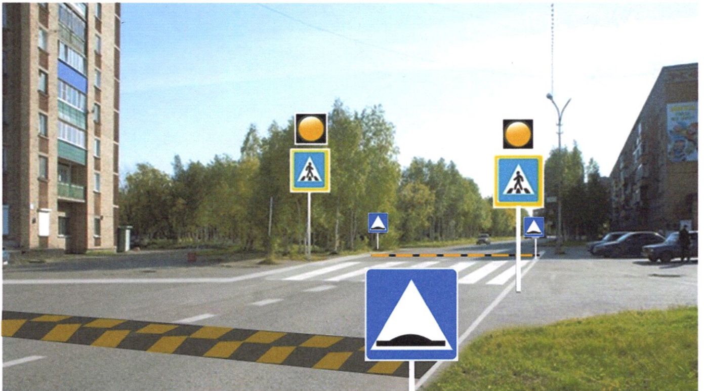
ул. Дзержинского д. №№ 19-25 - пешеходный переход