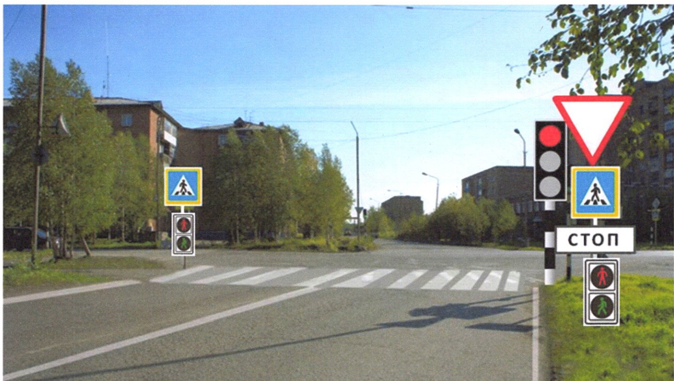
ул. Куратова д. № № 20-22 - пешеходный переход