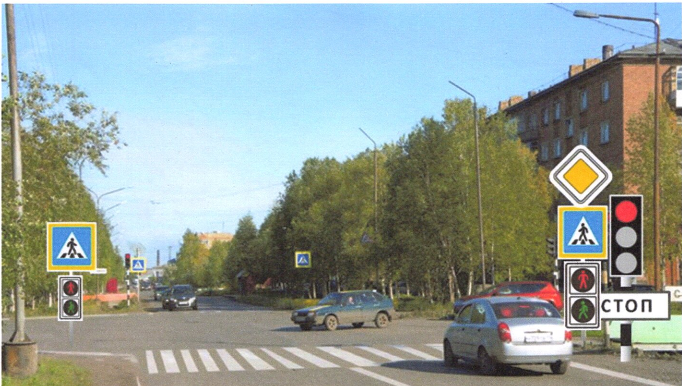
ул. Куратова д. №№ 19-22 - пешеходный переход